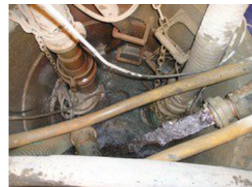
Collecting shaft with KTZ47.5 and KTZ35.5 in operation in snore mode