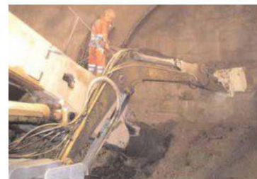
Portal with partial cut machine in operation