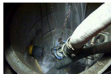
Collecting shaft with KTZ47.5 and KTZ35.5 in operation in snore mode